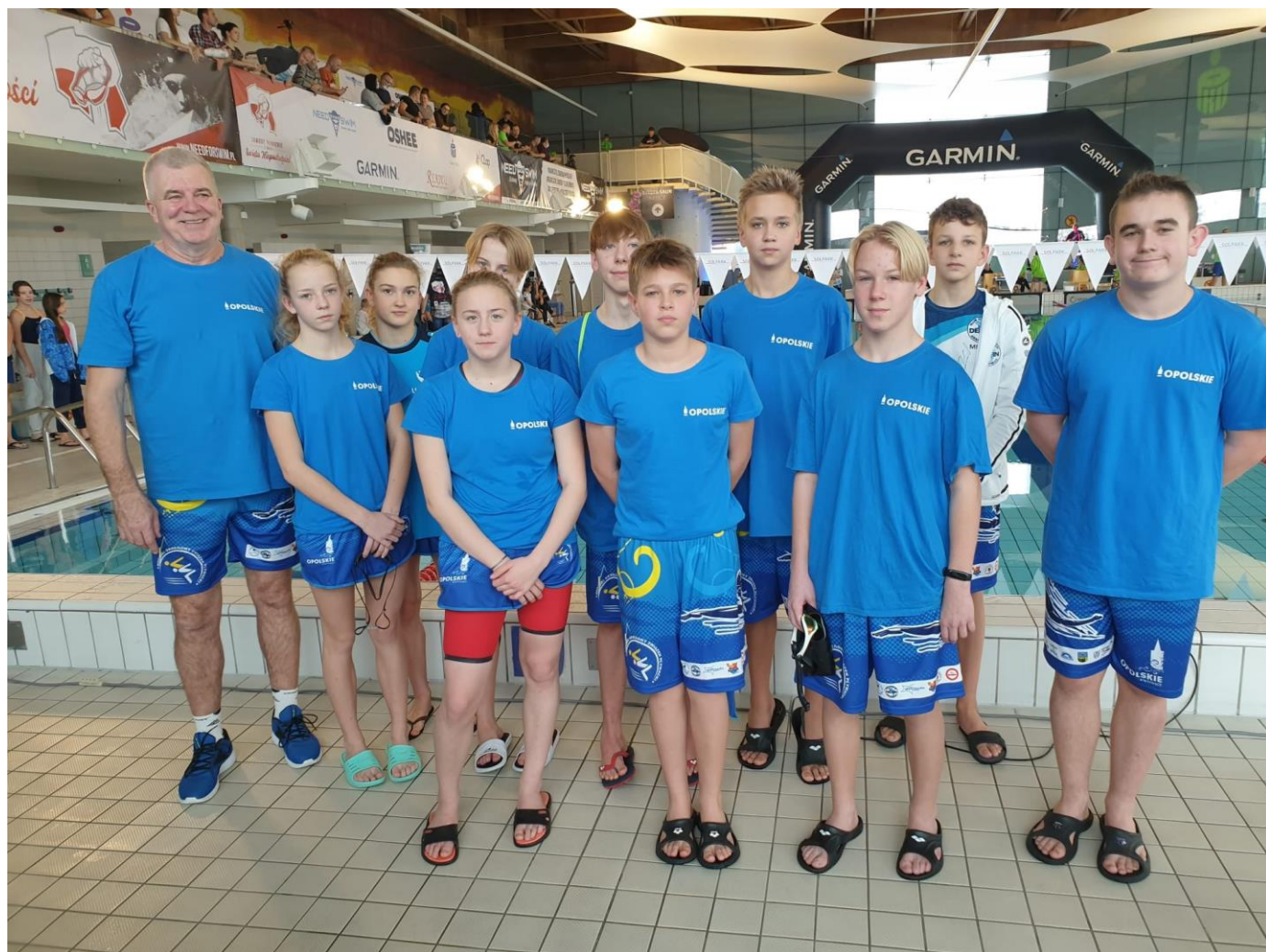
Kadra wojewódzka pływaków w koszulkach promujących Opolszczyznę.