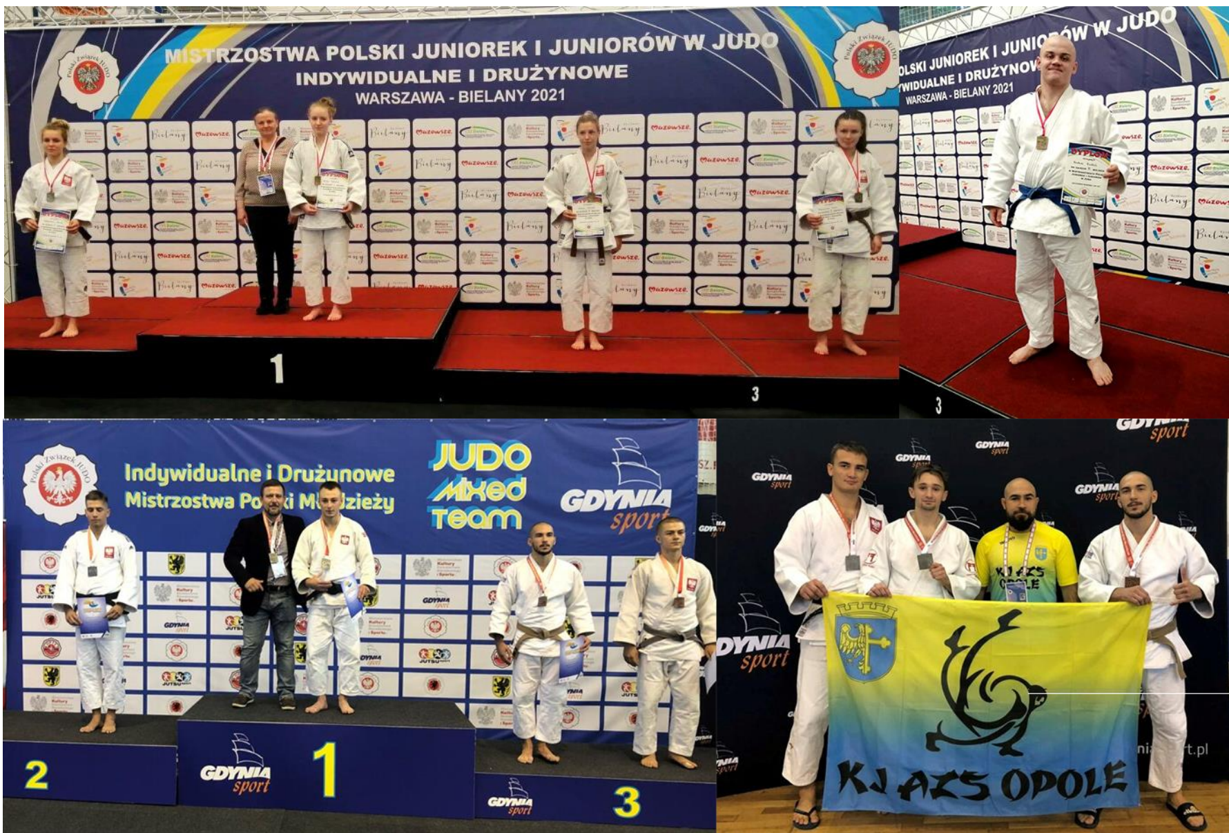
Judocy zdobyli w ramach współzawodnictwa sportowego młodzieży 141 punktów (9 miejsce w województwie) i 6 medali (1 złoty, 3 srebrne i 2 brązowe). Rok 2021 był dobrym czasem dla opolskiego judo.