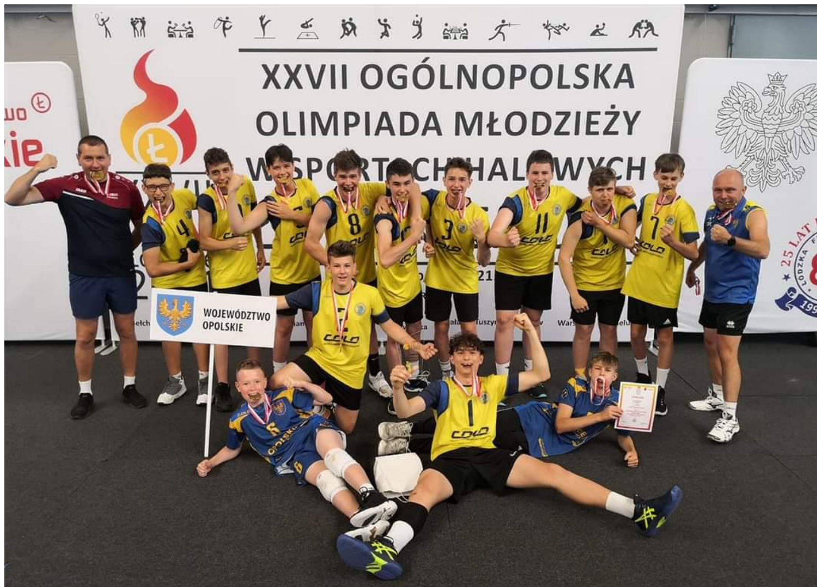
Wielki sukces siatkarzy na Ogólnopolskiej Olimpiadzie Młodzieży w Łodzi – złoty medal. Już dawno żadna drużyna z naszego województwa nie zaszła tak wysoko.