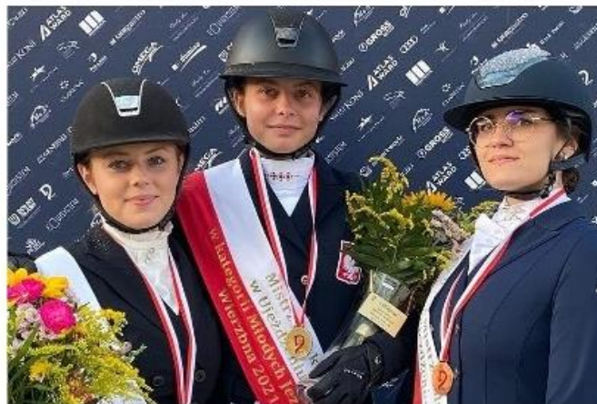
Zawodniczki LKJ Lewada Zakrzów w roku 2021 najlepsze w Polsce - 3 medale (2 złote i 1 srebrny).