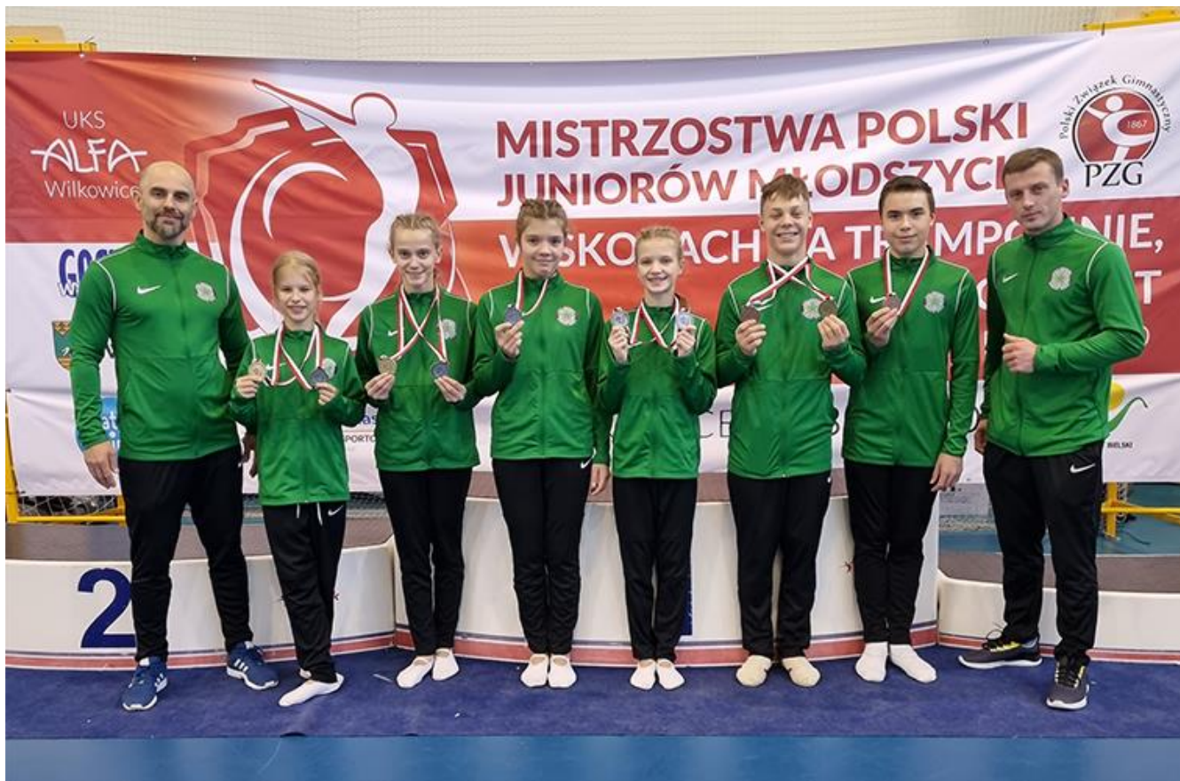
Gimnastycy LUKS Gwiazda Dobrzeń Wielki – w roku 2021 zdobyli 8 medali Mistrzostw Polski.