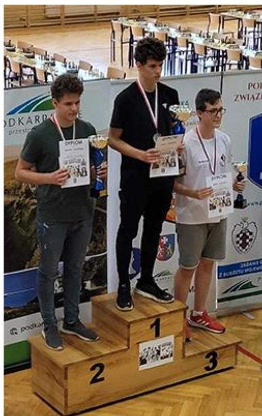
Rok 2021 był także dobry dla szachistów, którzy zdobyli 4 medale Mistrzostwa Polski (2 złote i 2 srebrne). Ponadto szachiści zdobyli 88 punktów w ramach współzawodnictwa sportowego młodzieży – wiodącym szachowym klubem sportowym na Opolszczyźnie jest UKS Rodło Opole .